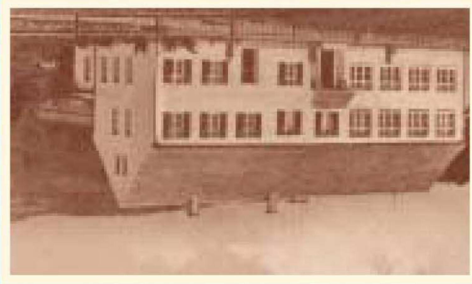
Schulhaus Leithen im Jahre 1917